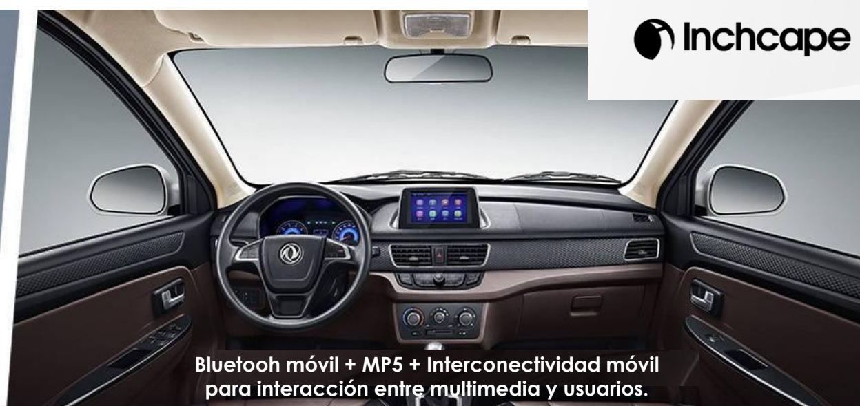
Bluetooth móvil + MP5 + Interconectividad móvil para interacción entre multimedia y usuarios.