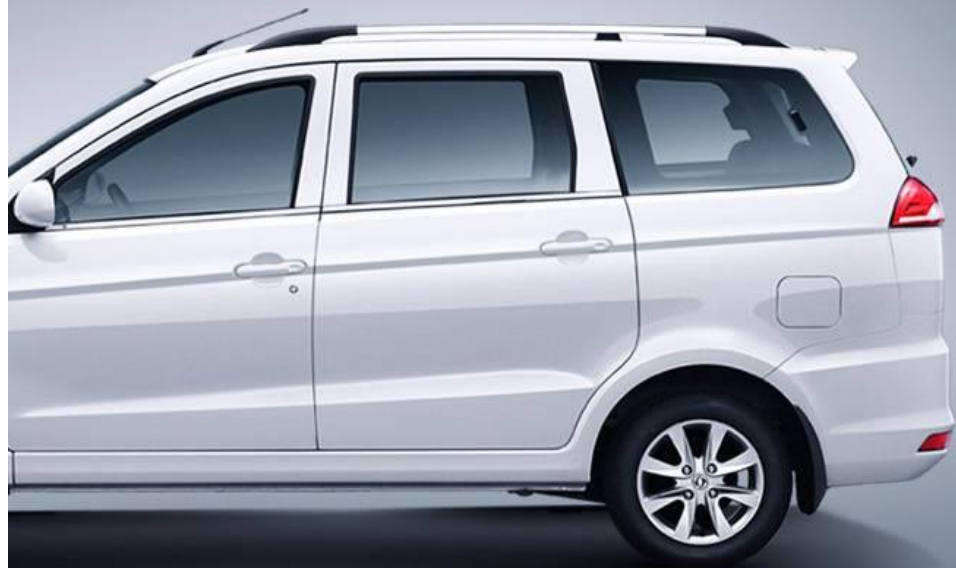
Cómoda suspensión trasera de Muelles en espiral.