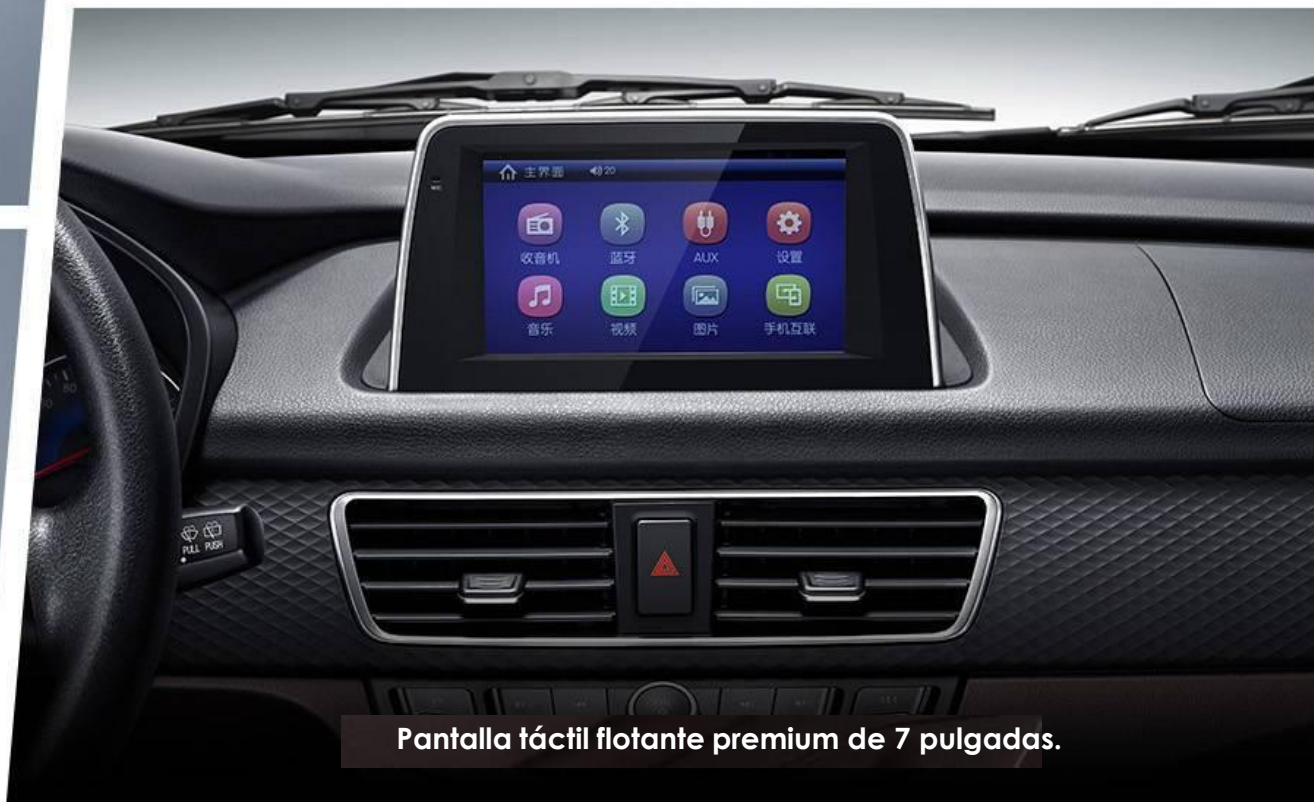
Pantalla táctil flotante premium de 7 pulgadas.